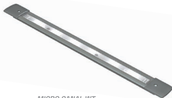
MICRO CANAL WT