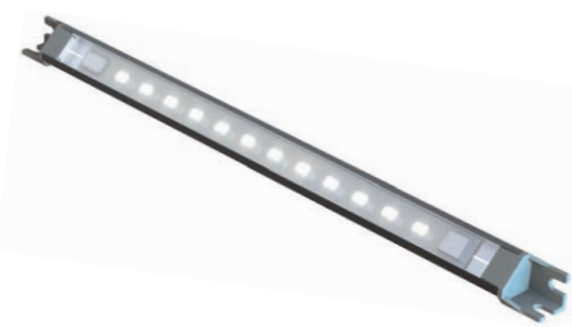
MICRO EDGE WT