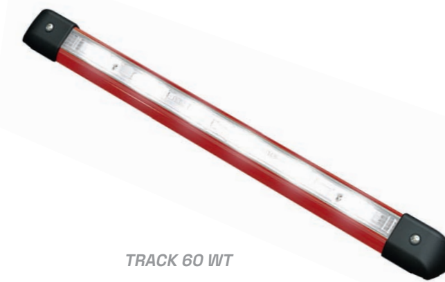
TRACK 60 WT