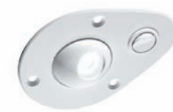
POWER LED SPOT